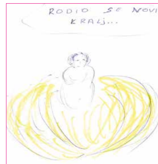
likovni radovi vjeroučenika trećih razreda