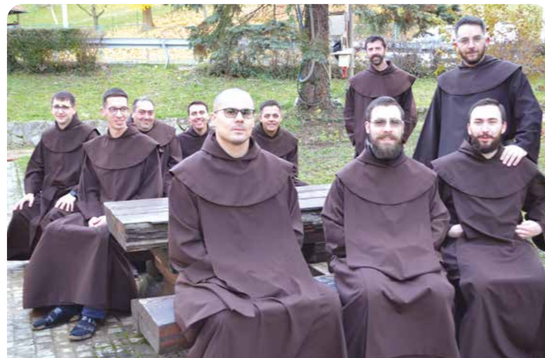
Svakodnevna druženja i molitva čine zajedništvo

Redovnici su svojim životom znak ovome svijetu da postoje neprolazne, vječne vrijednosti za koje smo spremni žrtvovati zemaljski najvrijednije: obitelj. Svakako da roditelji imaju velike brige oko toga da svoje dijete osposobe za ovaj svijet, što je potrebno, no